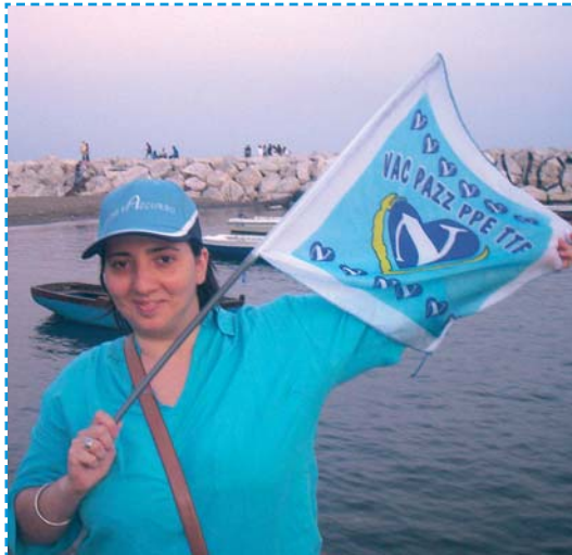
Anche la caporedattrice si lascia andare