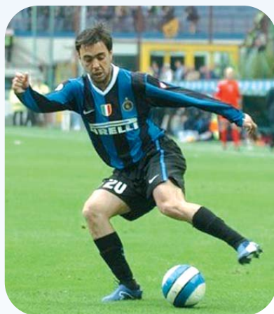
Alvaro Recoba, 31 anni

Quindi non sente suo lo scudetto assegnato dopo la scorsa estate