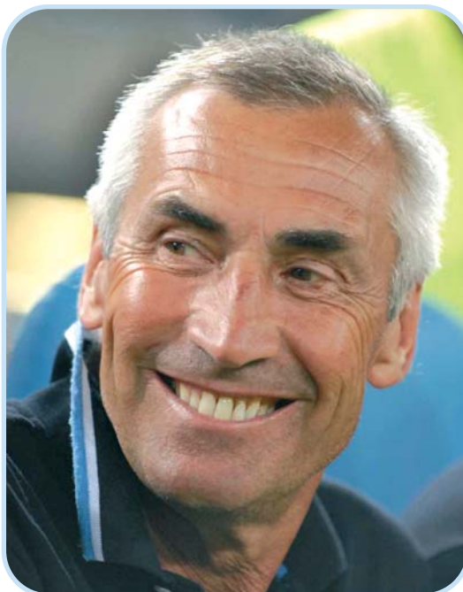
Edy Reja, 62 anni

raccontare. Mi avevano descritto Napoli come una città calorosa, partecipe degli eventi della propria squadra, ma mai avrei potuto immaginare di provare quanto ho provato. Vedere gente che sprizza gioia da tutti i pori, mi ha dato una felicità immensa. Mi sento come se qualcuno mi avesse tolto qualche anno. Non c’è nulla da fare, devo ammetterlo: vincere a Napoli è un qualcosa di davvero unico”. Clima idilliaco dunque quello che ha provato mister