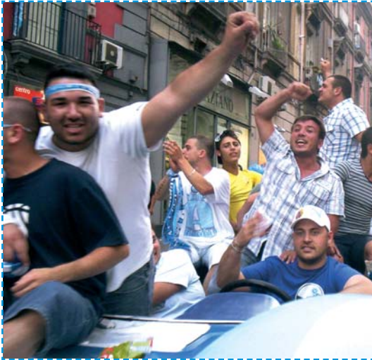
L'esultanza incontenibile a via Toledo