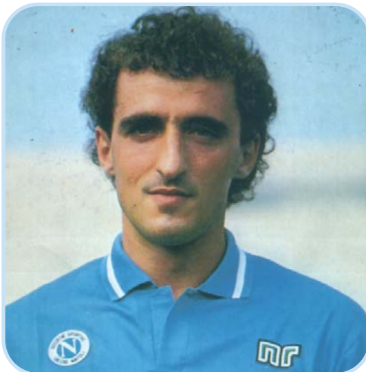
Alessandro Renica con la maglia del Napoli

"Parlare di quell'annata riapre ferite vecchie, fa male. Quello fu un campionato strano. A cinque