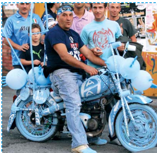
Una moto tutt'azzurra