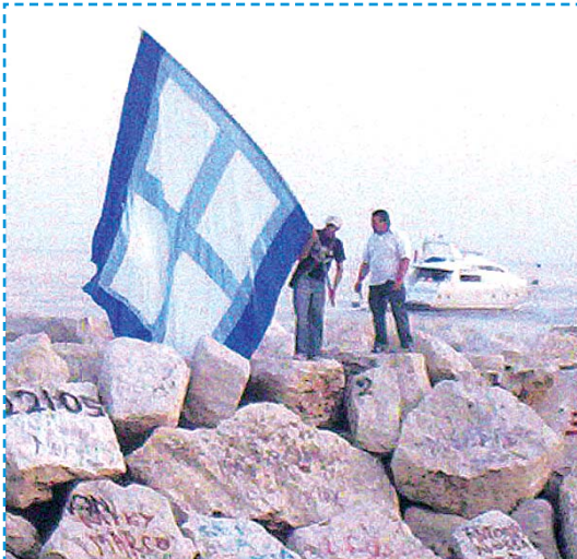
Si festeggia anche sugli scogli di Mergellina