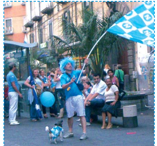
Vita da cani...