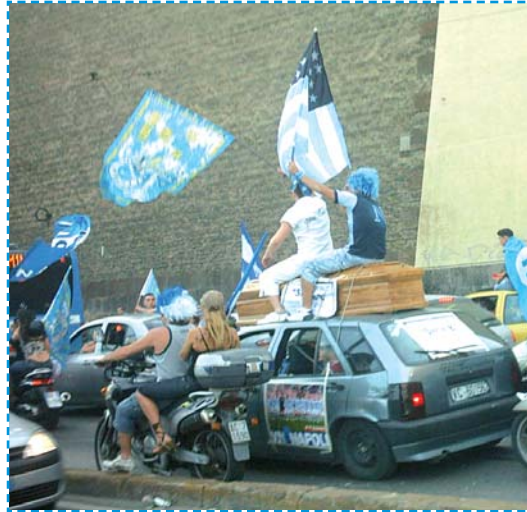
Celebrato il funerale alla B