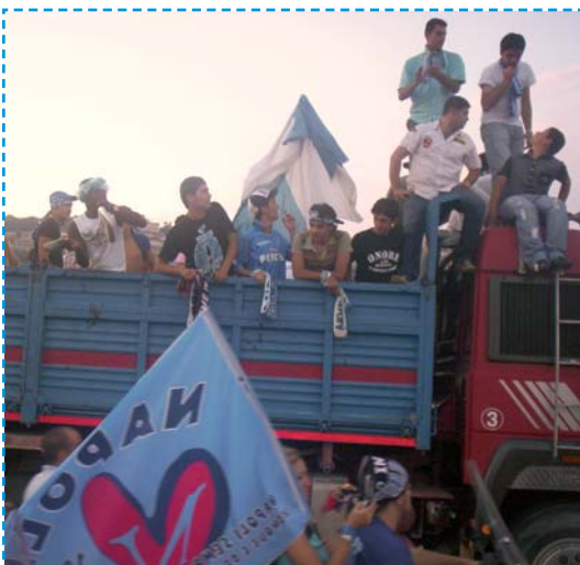
Una carovana carica di passione azzurra