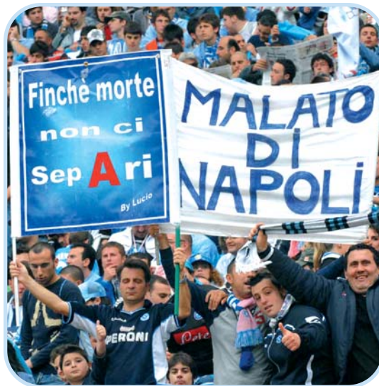
Il meraviglioso tifo azzurro

Se per la Champions le favorite sulla carta sembrano essere Inter, Milan e Roma con la outsider Juventus che potrebbe subito affondare il colpaccio (la vecchia signo-