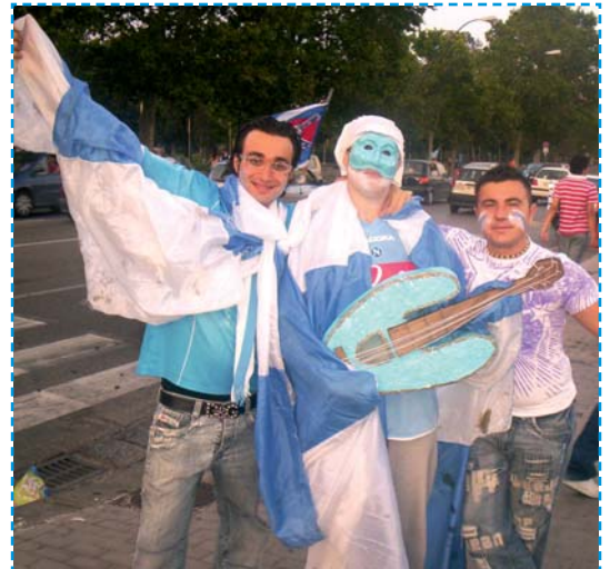
Pulcinella e il mandolino...