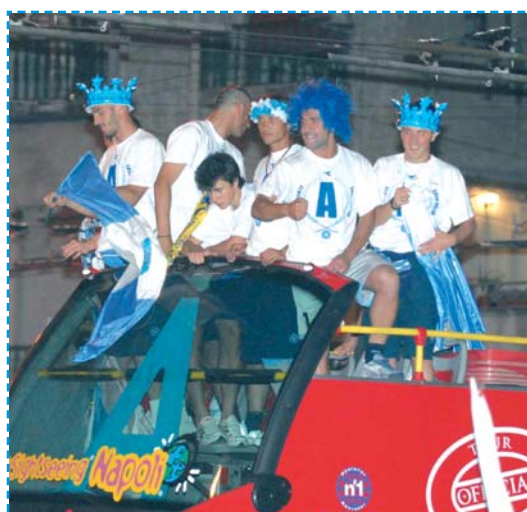
I calciatori con la bandiera del Napoli