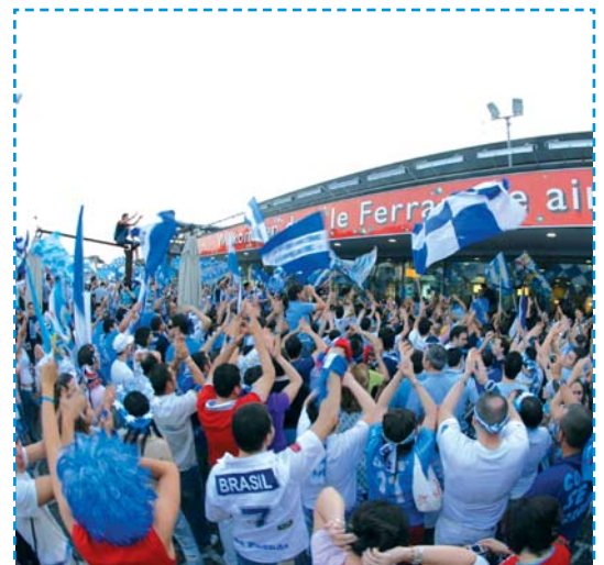
L'attesa della squadra a Capodichino