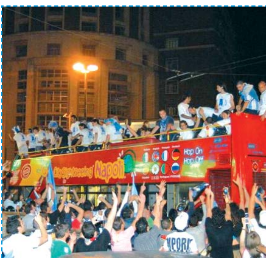
Il pullman azzurro si immette tra i tifosi