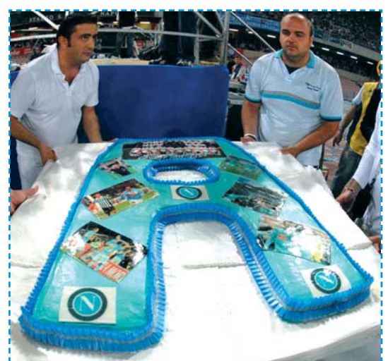
La torta per festeggiare la promozione