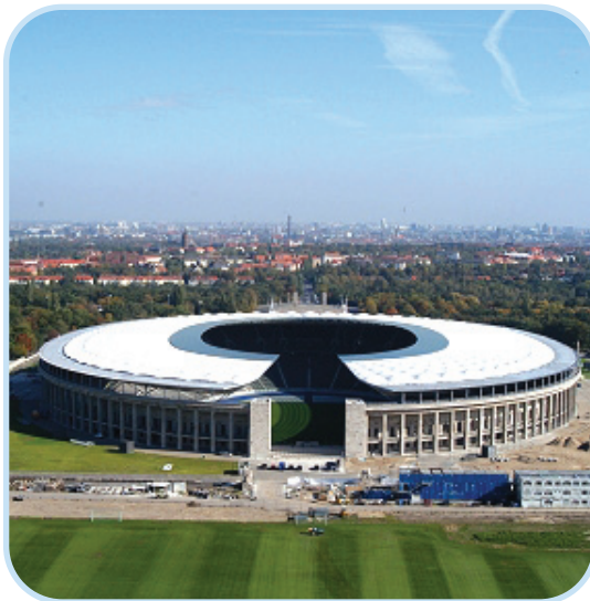
L'Olympia Stadium di Berlino

dagli episodi di violenza, quasi nulli rispetto a quelli avvenuti in Italia, nel resto d'Europa. Inoltre gli impianti europei, quasi tutti di nuova generazione, sono molto sicuri e consentono alle famiglie di andare a godersi uno spettacolo come se si andasse a teatro. Gli stadi europei offrono spesso al loro interno servizi aggiuntivi, come piccoli negozi della squadra del cuore, dove poter comprare gadget di ogni tipo griffato con il marchio "di casa", concezione di marketing che in Italia non è quasi per nulla presente e che consente alle società estere di poter fatturare un'importante cifra annua. Ma negli stadi moderni ci sono anche ampie vie di fuga, punti di ristoro più che attrezzati, rispetto ai venditori ambulanti che si