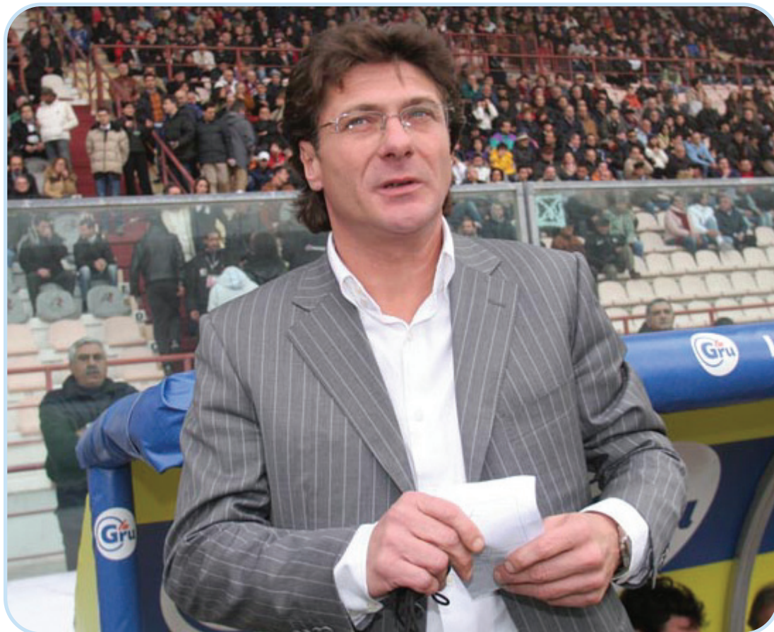
Walter Mazzarri, 45 anni

“Il pubblico di Napoli è eccezionale: è il dodicesi-