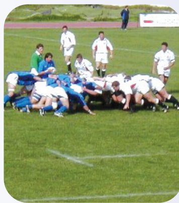
Un'azione della Partenope