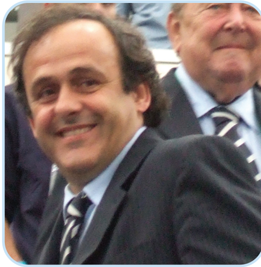
Michel François Platini, 52 anni

L'Italia si presentava all'Uefa da Campione del Mondo in carica (non vogliamo considerare eventuali "gelosie" come causa della bocciatura), con sulle spalle l'esperienza dell'organizzazione dei Mondiali nel 1934, 1990 e degli Europei nel 1968, vinto proprio dagli azzurri, e 1980. Presentava la sua grande tradizione calcistica, il suo n.1 nella classifica Fifa, le sue metropoli note in tutto il Mondo, Roma, Milano, Napoli, Firenze e così via. Presentava i suoi stadi, capienti e pieni di storia di questo sport. Presentava la sua voglia di migliorare e ripulire il pallone nostrano, per ospitare alla grande una edizione da ricordare del Campionato Europeo. E invece no. Bocciati. Tutte queste credenziali ignorate, o battute dalla candidatura polacco-ucraina, due nazionali mai qualificate alla fase finale degli Europei, nonostante i due terzi posti mondiali della Polonia datati '74 e '82, due nazioni nelle quali gli impianti di Kiev, Donetsk e Lvov sono da costruire da zero e gli altri, a Danzica, Poznan, Varsavia, Wroclaw (Polonia) e Dnipropetrovsk (Ucraina), da ristrutturare completamente. Anche i nomi delle città sono, con tutto il