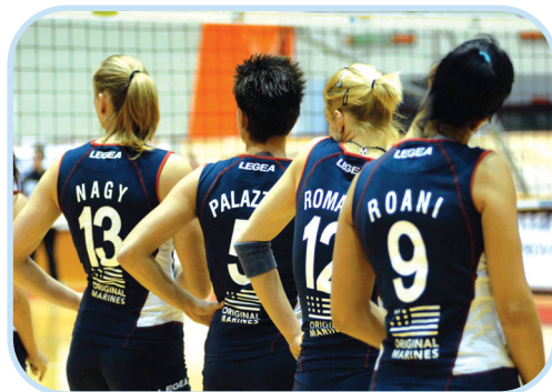
L'Original Marines Arzano

Nel mezzo ci auguriamo di trovare l'Original Marines che dovrà però lottare fino all'ultimo incontro. Chi continua a crederci è il pubblico arzanese, sempre presente e pronto ad incitare le proprie beniamine, accompagnandole soprattutto nelle trasferte difficili come quella contro l'Europa 92 Isernia, dove la posta in gioco era alta, salvezza per le padrone di casa e possibile candidatura dell'Original Marines ai play-off. Niente hanno potuto davanti però