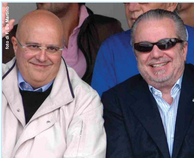
Pierpaolo Marino ed Aurelio De Laurentiis