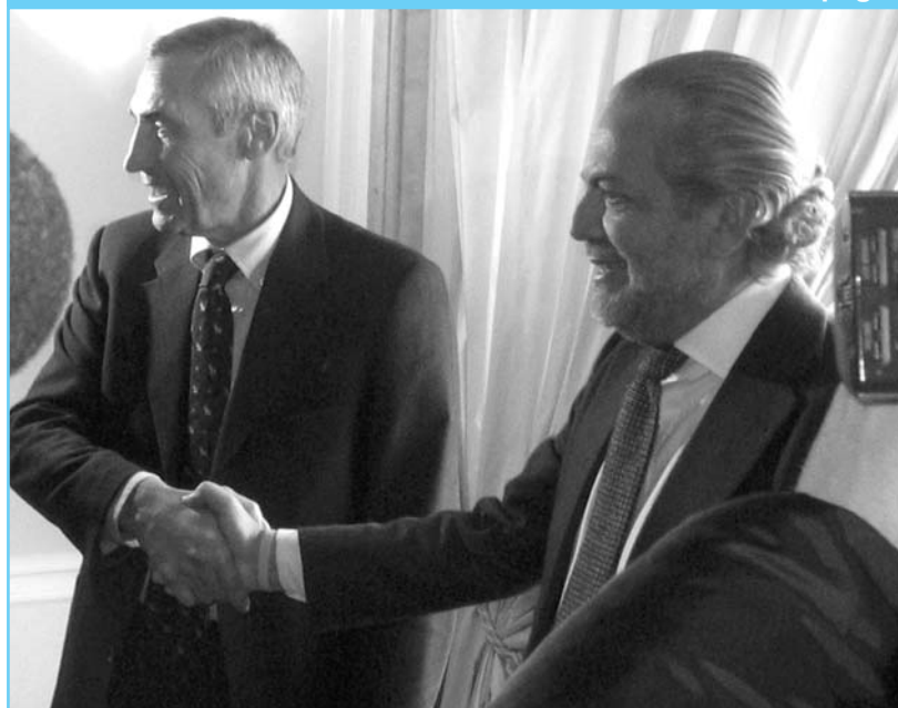
La sretta di mano tra De Laurentiis e il nuovo tecnico azzurro Reja