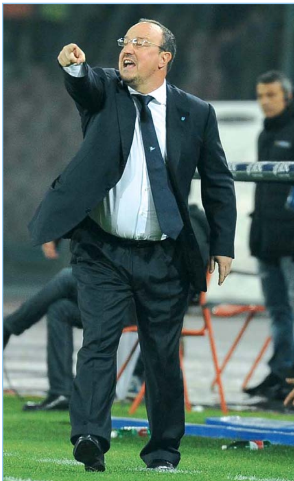
Rafael Benitez Maudes (Madrid, 16 aprile 1960)