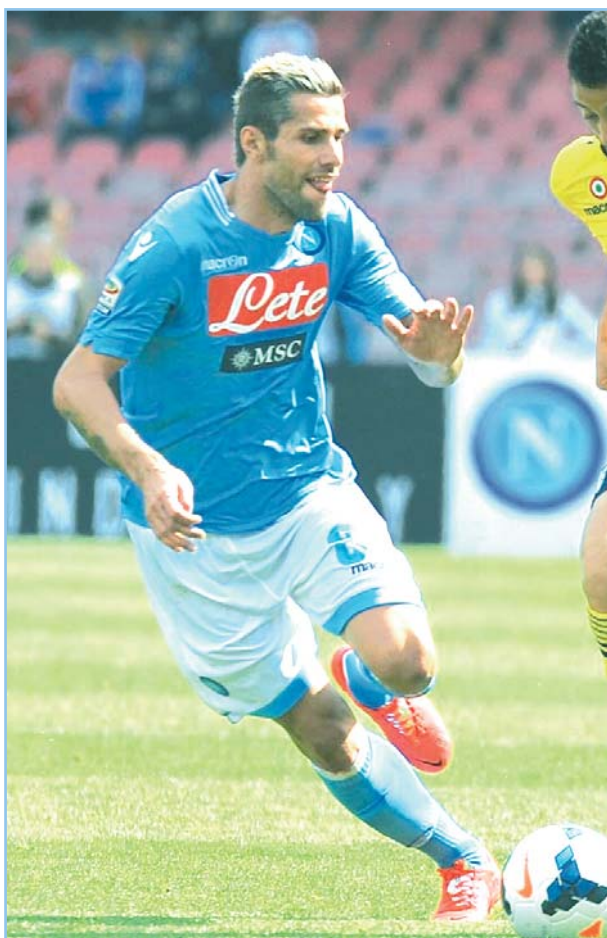
Valon Behrami (Titova Mitrovica, 19 aprile 1985)